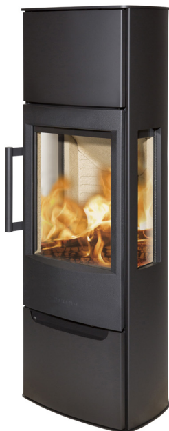
WIKING Miro 5