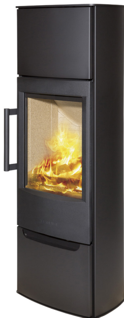
WIKING Miro 6