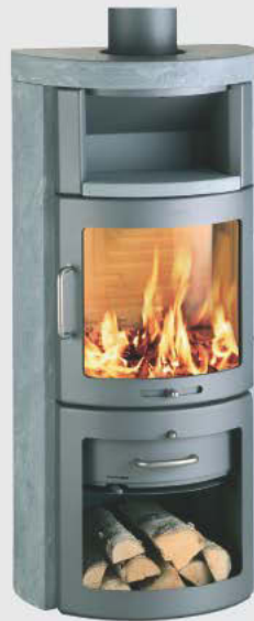
hwam Beethoven H